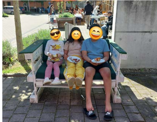
Oben: Wieviele Nutella-Brezeln kann man essen? Kinder aus der Nachbarschaft machen es vor. Lecker war's, Laune bestens! (unten)

Die Quartiersfeste bieten zahlreiche Gelegenheiten für Begegnungen und neue Kontakte. Es zeigte sich immer wieder, wie wertvoll Gemeinschaft, gegenseitige Unterstützung und gelebte Vielfalt für das Quartier sind. Das besondere Engagement vieler wunderbarer Menschen macht diese bereichernden Feste möglich. Danke!