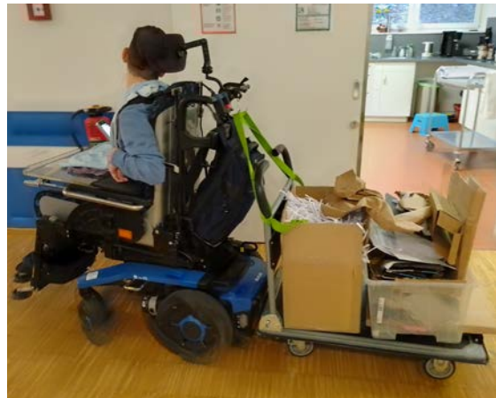
Kreative Nutzung der Rollstühle als Transportmittel.

Das ist nur ein kleiner Teil unseres Programms. Wir lesen außerdem die Zeitung, machen Musik, nicht zu vergessen, Snoezelen im ausgestatteten Raum, nutzen den Werkraum zum Handwerken und Basteln. Außerdem kommen Therapeuten für Ergo- und Physiotherapie auch in die Tagesstätte.