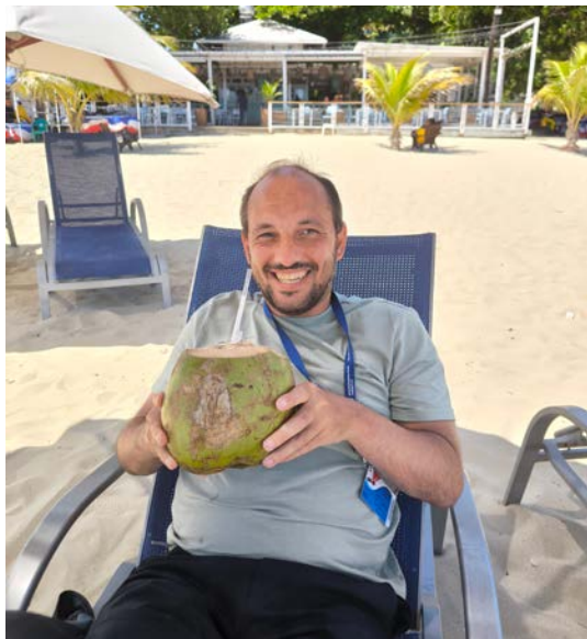
Eine frische Kokosnuss direkt am Strand

Auch hier hat es uns sehr gut gefallen und wir konnten die Zeit an Land optimal nutzen.