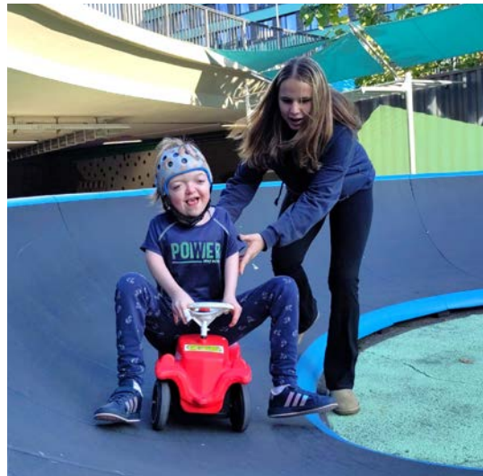
Mit dem Bobbycar auf dem Pumptrak

werden. Auch für die Mitarbeitenden war dies teilweise eine ganz neue Erfahrung. Mit Respekt und Barbaras Geduld haben wir es am Ende aber alle die Wand hoch geschafft. Nächstes Mal gehen wir vielleicht wieder auf den Abenteuerspielplatz Vaihingen oder zum Aktivspielplatz Raitelsberg, dort fühlen wir uns wie zu Hause.