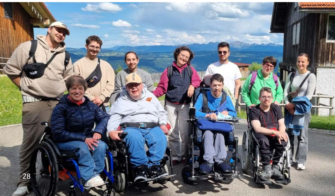
Aussichtreich: Die Freizeitgruppe vor herrlichem Bergpanorama

Natürlich durfte auch ein Besuch in Lindau nicht fehlen. Die malerische Inselstadt mit ihrem historischen Hafen, den schönen Gassen und der besonderen Lage am Bodensee lud zum gemütlichen Bummeln und Verweilen ein. Ein weiterer Ausflug führte uns nach Füssen. Schon die Fahrt dorthin war etwas