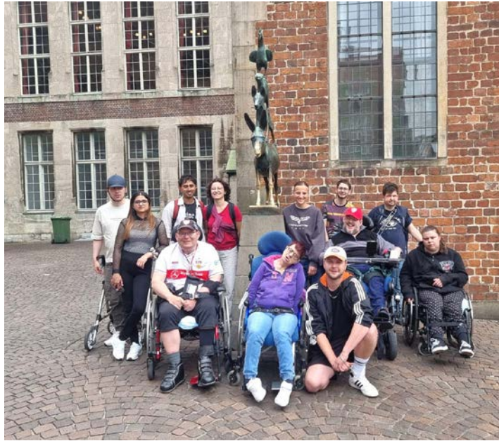
Gruppenbild mit den „Bremer Stadtmusikanten“

Ein Tagesausflug führte uns nach Bremen. Dort besichtigten wir die bekannte Statue der Bremer Stadtmusikanten und erkundeten die Innenstadt. Wir hatten alle sehr viel Freude daran, die Sehenswürdigkeiten der Stadt kennenzulernen und gemeinsam Zeit zu verbringen.