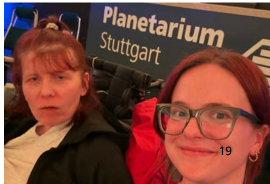
„Zeitreise“ im Planetarium

Die Hin- und Rückfahrt wurde zu einer kleinen Herausforderung. Während man mit der U-Bahn direkt bis zur Haltestelle Staatsgalerie fahren konnte und eine direkte barrierefreie Verbindung zum Planetarium hatte, war es für die Personen, die mit dem Auto kamen etwas umständlicher. Durch die große Baustelle gestaltet es sich schwierig einen Platz zu finden, an dem man kurz anhalten kann, um auszusteigen.