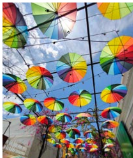
In der Karibik ist es überall bunt