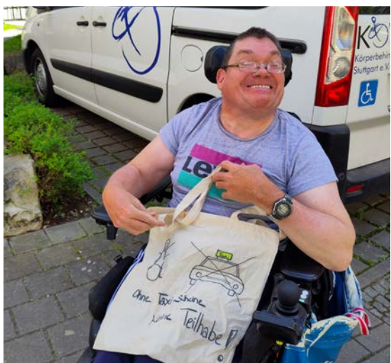
Ohne Taxigutschein keine Teilhabe!

mit dem Wegfall der Freiwilligkeitsleistung Taxigutscheine die Menschen mit Behinderungen einzeln entsprechend ihrem individuellen Bedarf einen Antrag auf Eingliederungshilfe (Mobilität zur sozialen Teilhabe) stellen können. Gut zu wissen: Leistungen der Eingliederungshilfe sind Pflichtleistungen und müssen unabhängig von der Haushaltslage der Stadt bewilligt werden, wenn der einzelne Mensch die Voraussetzungen erfüllt. Was also ist zu tun?