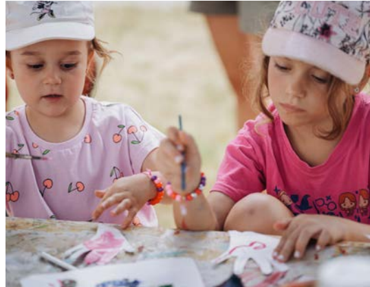
Die kreative Angebote wurden viel genutzt und es entstanden wunderbare Kunstwerke