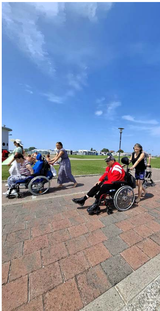
Spaziergang an der Küste

über den Sand bis ans Wasser zu gelangen und sogar im Meer zu baden. Diese Möglichkeit wurde von den Teilnehmenden mit großer Begeisterung genutzt und sorgte für viele unvergessliche Momente.