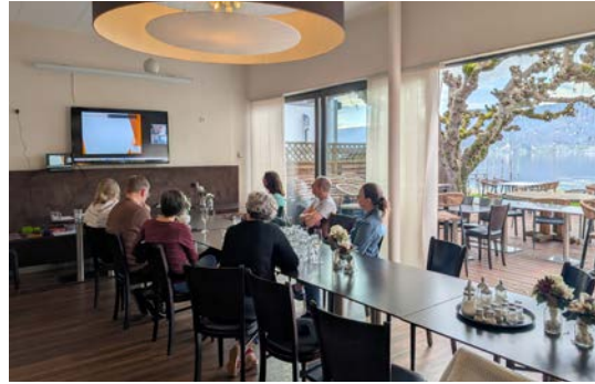
Online-Workshop für die Eltern

Das Feedback war durchweg positiv und wir alle, sowohl Familien, als auch Mitarbeiter:innen, konnten glücklich und mit tollen Erfahrungen im Gepäck nach Hause fahren.