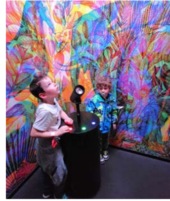
Echt spannend: Die experimenta

Unsere Familienfreizeiten werden durch das Landesprogramm Stärke gefördert.