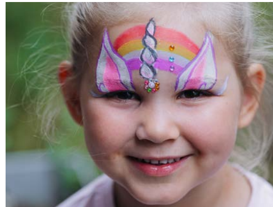
Phantasieschminken kam gut an (oben) Danke für viele Kuchenspenden (unten)