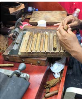
Besuch in der Zigarrenfabrik