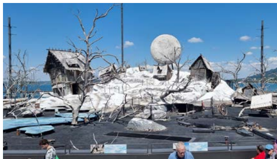
Beeindruckend: Kulisse auf der Seebühne für Carl Maria von Webers Oper „Der Freischütz“ bei den Festspielen in Bregenz 2025

Auch ein Tagesausflug nach Bregenz stand auf dem Programm. Besonders beeindruckend war die riesige Kulisse der Bregenzer Festspiele am Bodensee.